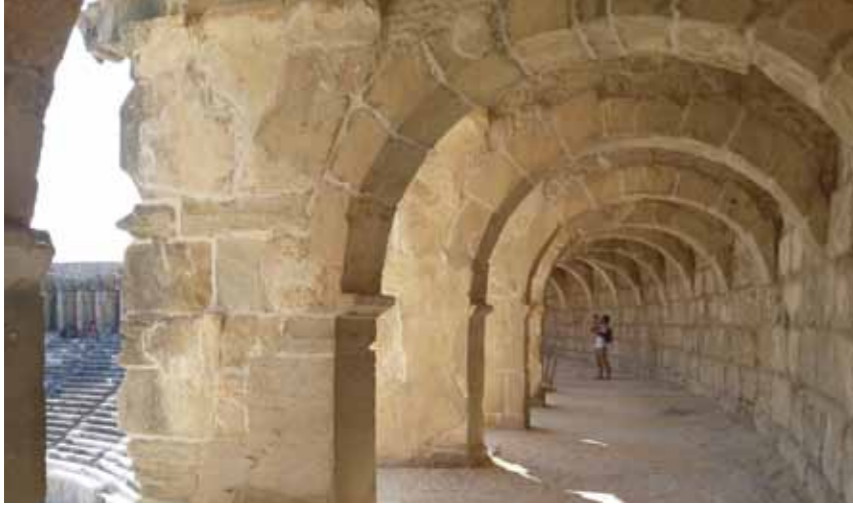
Aspendos Tiyatrosu, iki bin yıla yakın geçmişi ve yaşadığı değişimlerle birlikte mimari bütünlüğünü büyük ölçüde koruyarak günümüze ulaşmış, antik dünyanın en görkemli anıtlarındandır. Anıtın geçmişten gelen bilgi bütünlüğünün korunması ve yaşatılmasının sağlanması için restore edilmesi kaçınılmazdır.

nan bilimsel bir disiplindir. Amacı, kültür varlığının estetik ve tarihi değerini korumak ve ortaya çıkarmaktır. Bizden önce yaratılmış bir anıtın koşullarına sadık kalmak, en az müdahale ile en iyi korumayı sağlamak çağdaş koruma düşüncesinin gereğidir. Her bir kültür varlığının kendine özgü koşulları ve bu koşulların gerektirdiği çeşitli müdahaleler söz konusudur. Bunun gereği olarak restore edilecek bir yapının durumunun incelenmesi, bozulma nedenlerinin araştırılması, sorunların saptanması ve buna göre müdahale yöntemlerinin oluşturulması gerekir. Tüm kararlar ve müdahaleler metodik ve bilimsel incelemelere uygun olarak alınmalı, uygulamalar bu yönde devam ettirilmelidir. Bu da ancak disiplinler arası işbirliği ile mümkün olabilir. Restorasyonda hangi yöntemlerin ve malzemelerin kullanılacağı da büyük önem taşır; bilgi ve deneyim sahibi restoratör veya uzmanlardan oluşan restorasyon ekibi en doğru tercihleri yapacaktır.