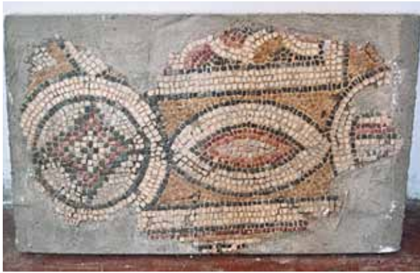
Fig. 2 İznik Müzesi'nde çimentolu yeni taşıyıcıya sabitlenmiş mozaik pano (2006)