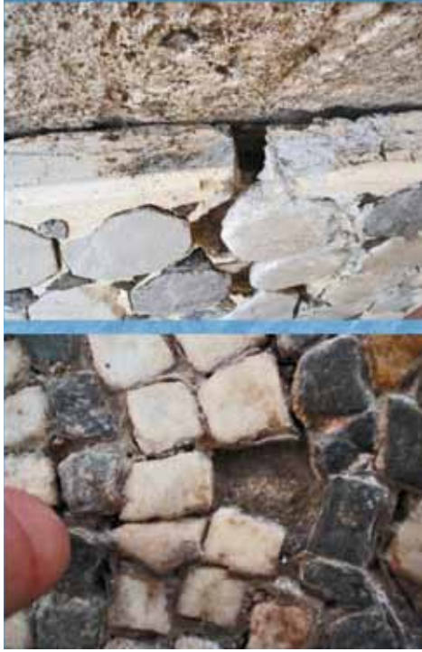
Fig. 5 İzmit müzesi, beton taşıyıcıya aktarılmış mozaikte tahribatlar (2006)

nyaylonla örtülerek korunmaya (?) alınan (Res. 4) veya onarımı bittikten sonra açıkta ve doğal şartlara emanet edilen mozaikler bize müze ve sit alanlarında korumada yetersizliğin açık göstergelerini oluşturmaktadırlar. Daha doğrusu, koleksiyonlarında yer alan mozaiklerini, daha çok, bir şekilde depolama ve/veya sergileme telaşıyla uğraşan müzelerimizin, bunların nasıl korunması gerektiği konularında yeterli desteği görmediklerinin göstergeleridir, bu örnekler. Nitekim kolay, ucuz (ve hatta geleneksel olduğunu düşünmeye başladığımız) uygulama örneklerini oluşturan beton taşıyıcılar, müze alanı içinde, ancak bahçede bir yerlerde depolanan mozaikler, tesseraları dökülmekte olan yeni taşıyıcılar ve yeni taşıyıcısıyla birlikte kırılan çatlayan mozaik panolar gibi örnekler de (Res. 5), uygun olmayan yöntemleri işaret etmektedirler. Örneklerin çokluğu bunun bir veya birkaç müzenin sorunu olmadığını, nedeni çok çeşitli sebeplere bağlı olmakla birlikte, genel bir koruma yaklaşımı eksikliği olduğunu göstermektedir.