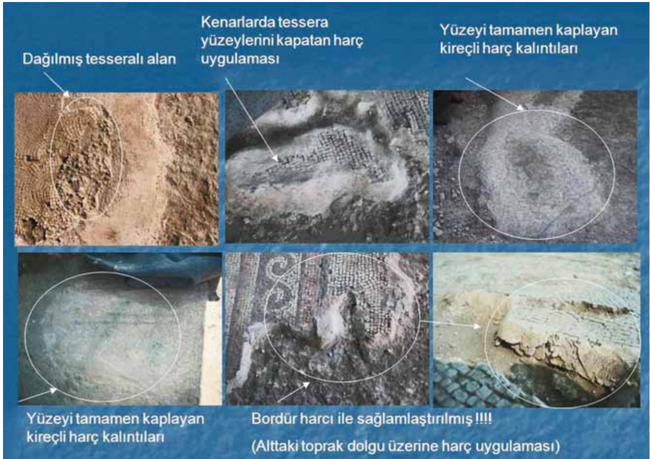
Fig. 9 Urfa Haleplibahçe mozaikleri, ikinci (2008) onarım hataları