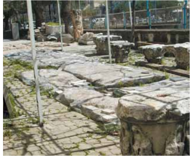
Fig. 4 Antakya Müzesi, müze bahçesine naylon altında korunan mozaik panolar (2005)