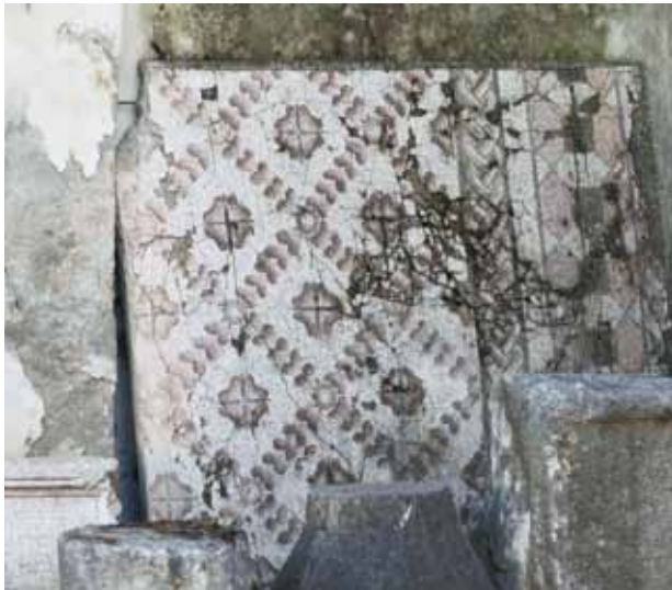
Fig. 3 Antakya Müzesi'nde çimentolu yeni taşıyıcıya sabitlenmiş mozaik panolar (2005)

Aizanoi mozağindeki onarım çalışması, hatalı malzeme seçimi ile ileride ortaya çıkacak sorunları öngörmeyen; bu nitelikleri ile de eserin korunmasından çok, alaylı (geleneksel) onarım müdahalesinin tipik örneğini oluşturmaktadır.