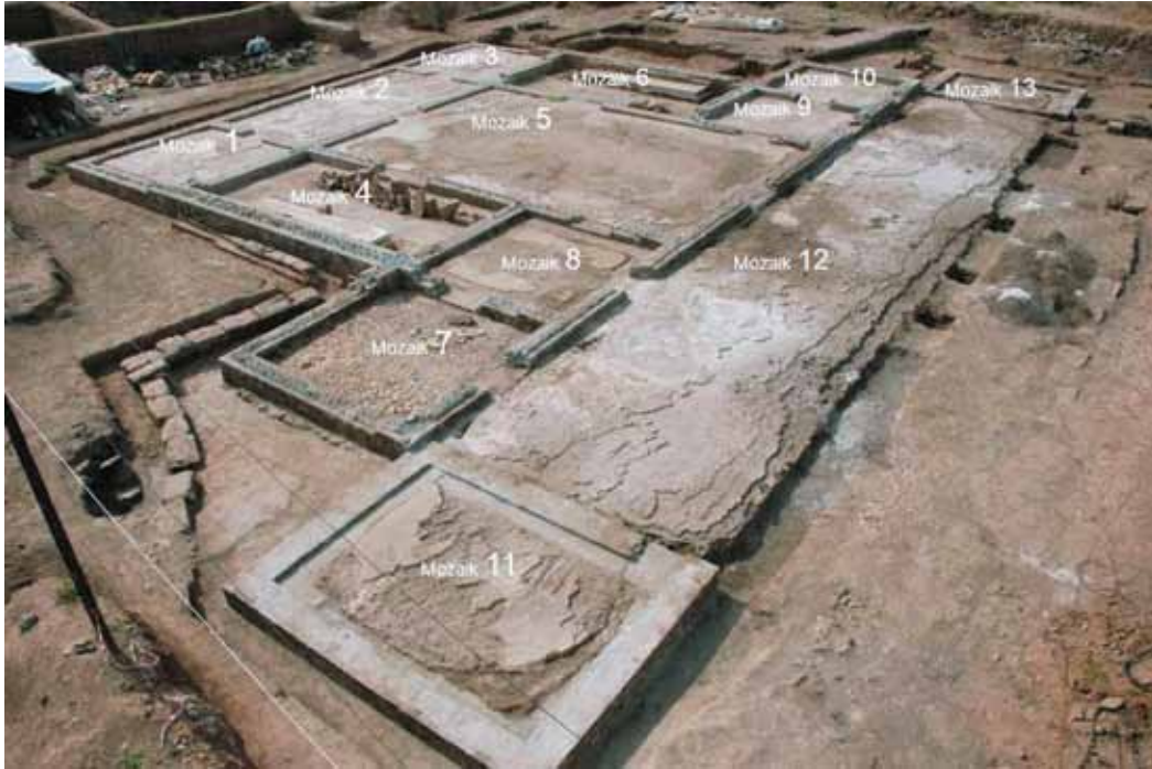
Fig. 10 Urfa Haleplibahçe mozaikleri, üçüncü onarım çalışmaları sırasında (Mayıs 2009)

imzalamış olduğumuz uluslararası kabul gören kararlar esere minimum yani en az ve en doğru müdahaleyi zorunlu kılmaz mı?