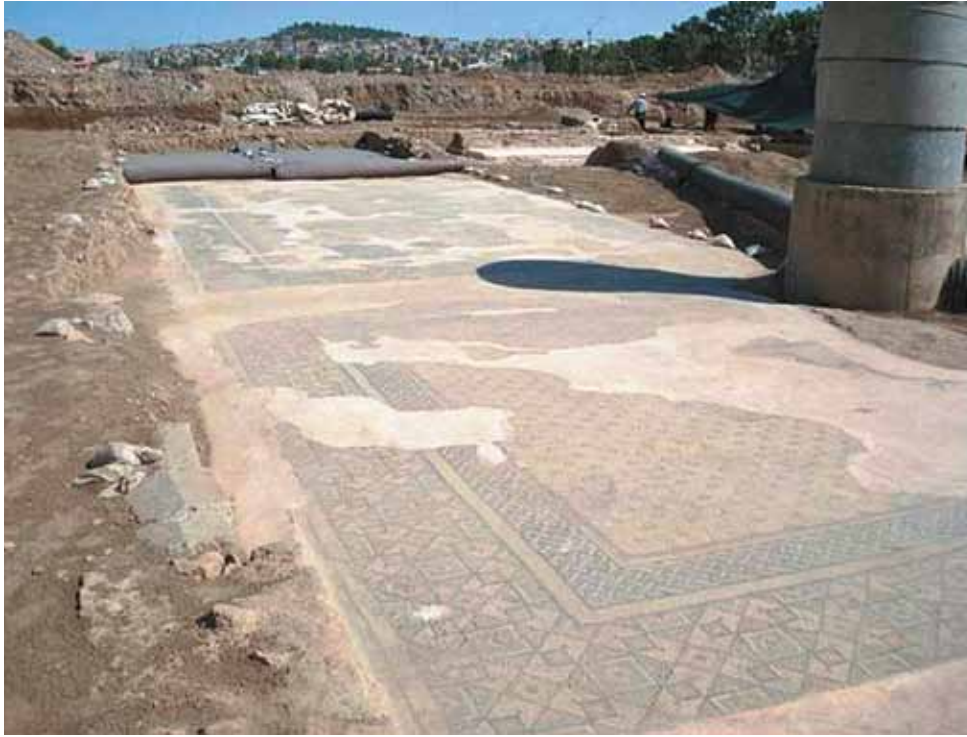
Fig. 7 Urfa Haleplibahçe mozaikleri, ilk (2007 ) onarımında yapılan hatalı tamamlamalar

yanlış malzeme seçimine dayalı uygulamalar, aceleci, eksik, hatalı uygulamalar mozaikte yeni sorunlara yol açtığı için, ne yazık ki daha doğru malzeme ve yöntemin uygulandığı ikinci bir müdahaleyi şart kılar.