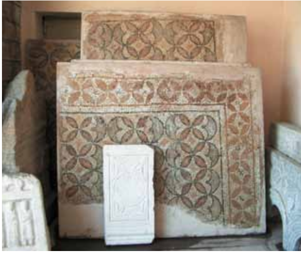
Fig. 1 Konya Müzesi'nde çimentolu yeni taşıyıcıya sabitlenmiş mozaik panolar (2005)